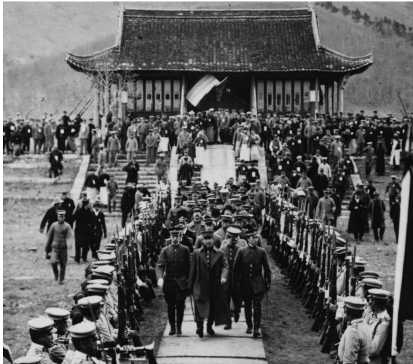
Figure 3 Sun Yat-sen, au centre, quittant cérémonieusement le tombeau du premier empereur Ming

Cependant, son adoption ultérieure des appellations Zhongshan ou Guofu , le « père de la nation », ainsi que la centralité qui lui est attribuée dans le renversement effectif de la dynastie mandchoue, relèvent largement d'une reconstruction rétrospective de son rôle historique 218 . La révolution Xinhai ne fut pas l'œuvre d'un seul leader, mais plutôt le produit d'une conjonction de facteurs comprenant la dissidence militaire, la fragmentation provinciale et surtout l'aboutissement d'un compromis politique entre acteurs aux intérêts divergents. La naissance de la République de Chine ne peut donc être réduite à l'accomplissement du projet d'un unique révolutionnaire. Elle doit plutôt être comprise comme le résultat d'un processus révolutionnaire long et fragmenté 219 , dont la mémoire politique fut ultérieurement simplifiée, notamment par l'historiographie nationaliste du Guomindang, afin d'incarner la rupture dynastique dans la figure d'un père fondateur.