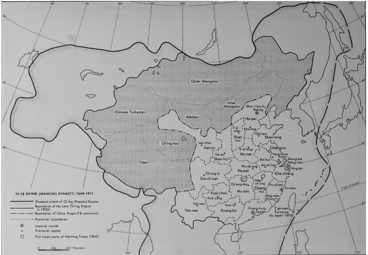
Figure 1 Carte de l'étendue territoriale de la Dynastie Qing